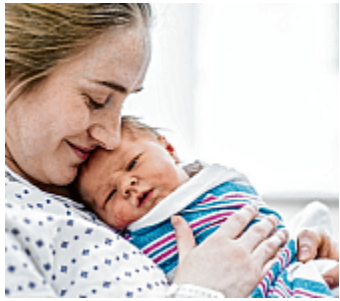
Im Durchschnitt sind die Mütter bei der Geburt 31 Jahre alt.